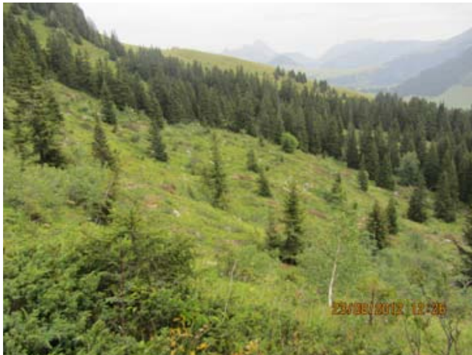
Travaux forestiers en faveur du tétras-lyre / le Larzey